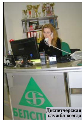
Диспетчерская служба всегда на связи.

ными системами. В течение суток выполняются даже самые сложные заявки. К сожалению, в городах еще есть факты вандализма. Иногда молодежь балуется с мощными электрошокерами и таким образом сжигает все оборудование. Боремся. В связи с тем, что многие домофоны уже отслужили положенный срок,